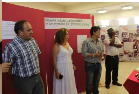
Título de la exposición e inauguración por el Director del EAHNM y la Directora de la ENAH