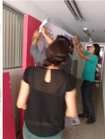
Montaje por maestras y alumnos