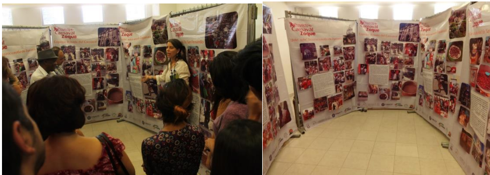
Visita guiada y explicación de los carnavales zoques por su servidora