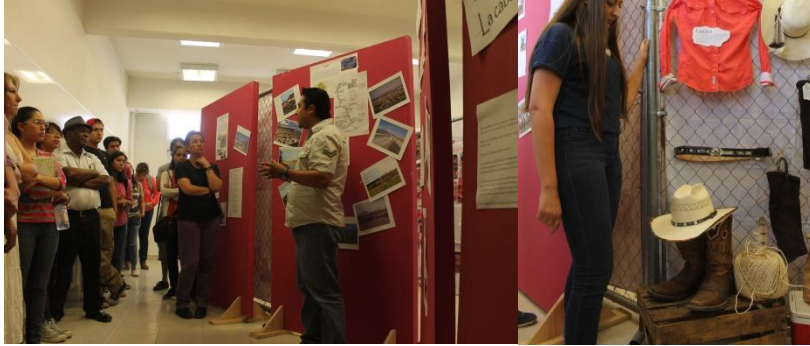
Visita guiada y explicación por alumnos