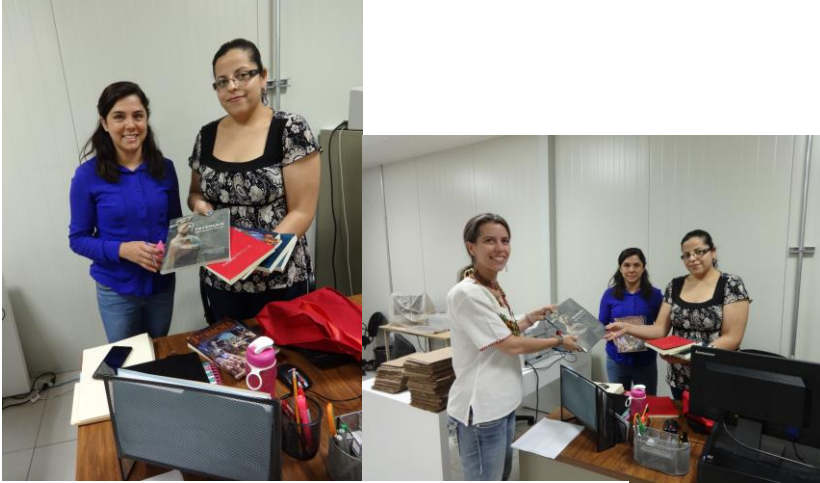
Entregando libros en la biblioteca de la EAHNM

En las pláticas con el personal de la EAHNM se estableció que ya existe un convenio general entre el INAH y la UNICACH, por lo cual no se necesita de un otro convenio para la EAHNM facilitando el acercamiento inter-institucional. Se inició las discusiones para posibilidades de un convenio específico aunque es correcto decir que esa definición depende de nosotros también y los recursos disponibles por ambas partes.