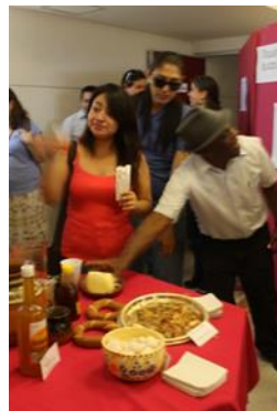
Explicación de la degustación y luego ya la llegada a la degustación