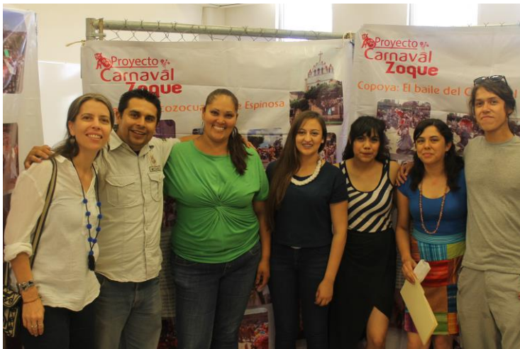
Foto para el recuerdo, alumnos de la Licenciatura de Antropología Social y las maestras

Cedula final con agradecimientos y apoyos mencionados